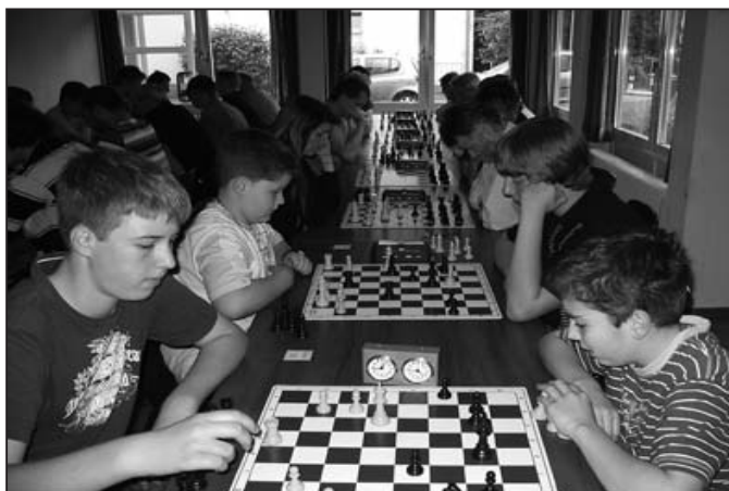
Die vier jugendlichen Teilnehmer unseres Vereins.