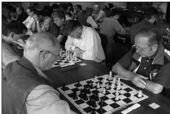
Blick in den Turniersaal.